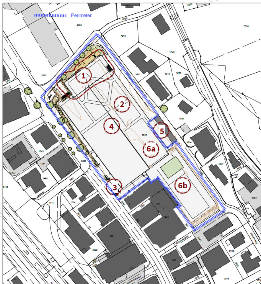
Abbildung 2: Situationsplan aus Vorprojektstudie Jaggi & Partner AG

Die vorliegende Ausschreibung betrifft nur die Teilobjekte 2 und 4 (inkl. 6a und 6b) . Die Teilobjekte 1, 3 und 5 sind nicht Gegenstand dieser Ausschreibung.